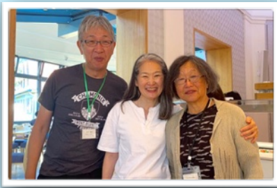
夫そしてフーヴェク栄姉と

若い兄弟姉妹と共に祈り、準備を進めてきた日々は尊く、恵みと慰めに満ちたひと時であった。集いに参加する子どもたちのため、そのご家族のため、また集められた奉仕者お一人おひとりのために祈ることができる恵みに感謝した。