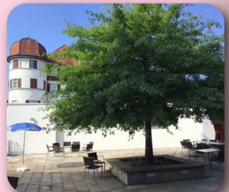
8月6日(土) “賛美と証しの夕べ”における証し

「死の陰の谷を行くときもわたしは災いを恐れない。あなたがわたしと共にいてくださる。」詩篇のこの言葉も、いじめられている時には知らない言葉でしたが、確かに私は自分自身がこのみ言葉を体験していたのだと、同時に悟りました。